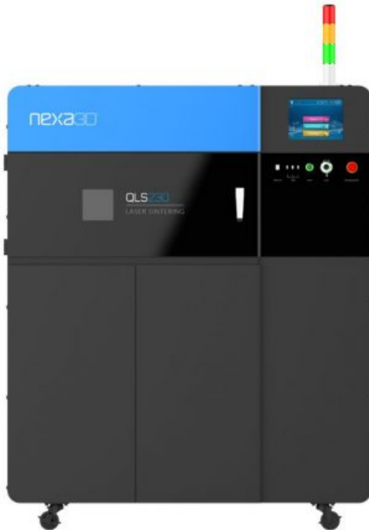
Stampante 3D Nexa3D QLS 230

https://www.datamanager.it/2023/09/ts-nuovamacut-avvia-una-nuova-partnership-con-lazienda-californiana-nexa3d/