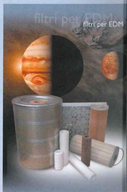
filtri per EDM

La ditta LPA s.r.l. opera nel settore degli stampisti e nello specifico dell' elettroerosione ormai da 10 anni, durante i quali ha selezionato e sviluppato una gamma di prodotti di prima qualità, inerenti il mercato in oggetto. Gli obiettivi della nostra azienda sono sempre stati la qualità e il servizio , cose che ci hanno permesso, sia in passato, che tuttora, di poter assistere direttamente qualsiasi cliente su tutto il territorio nazionale . Grazie alla nostra particolare struttura interna, siamo in grado di avere sempre la merce pronta per servire in velocità e flessibilità le più svariate esigenze.