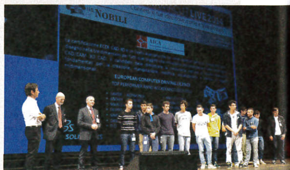
La premiazione dei ragazzi dell'Istituto Tecnico Nobili di Reggio Emilia

Molto interessanti anche le sessioni tecniche con dimostrazioni di prodotto, approfondimenti tematici, sessioni di manufacturing e di realtà virtuale.