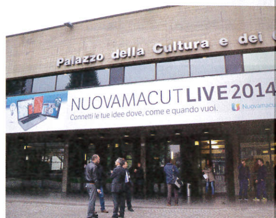
L'evento si è svolto presso il Palazzo della Cultura e dei Congressi di Bologna

Per testimoniare la validità dei prodotti Nuovamacut e Dassault Systèmes sono in-