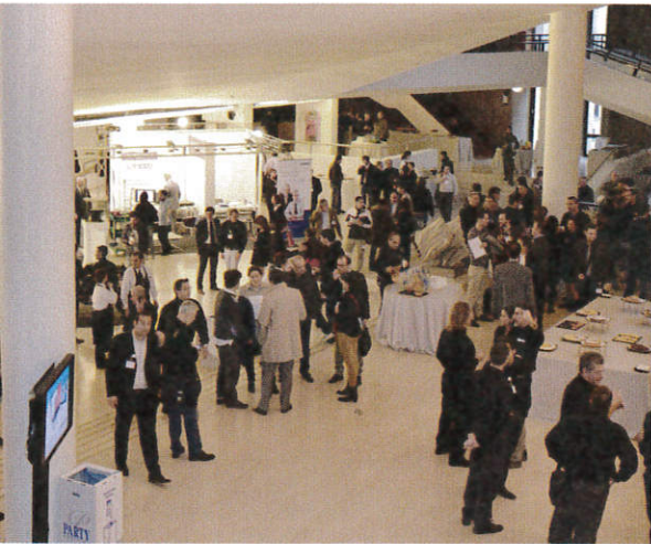
Un momento della pausa pranzo