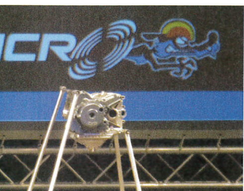
Il motore realizzato interamente in titanio presentato da NCR