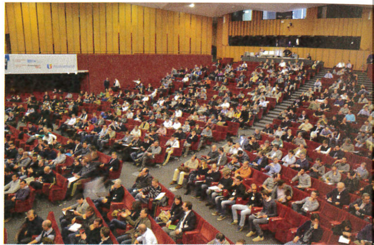
Come l'anno scorso, Nuovamacut Live 2014 ha attirato moltissimi operatori del settore

breve termine, e impieghi dei servizi cloud per quanto riguarda gli sviluppi a lungo termine».