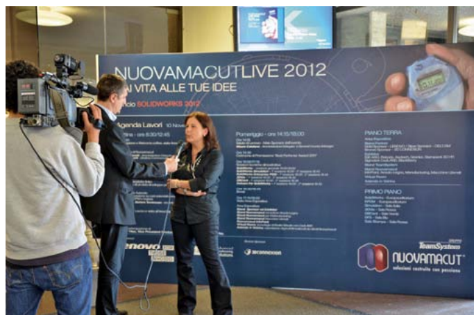
Alcuni momenti del Nuovamacut Live 2012 al quale hanno partecipato oltre 1.000 persone

Attraverso un'interpretazione di tutti i ruoli aziendali coinvolti nello sviluppo di un nuovo prodotto, la sessione "Dall'idea al prodotto finito: un processo di sviluppo prodotto integrato" ha reso protagonista il cronometro